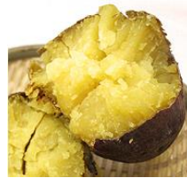
いも掘り体験と焼き芋試食