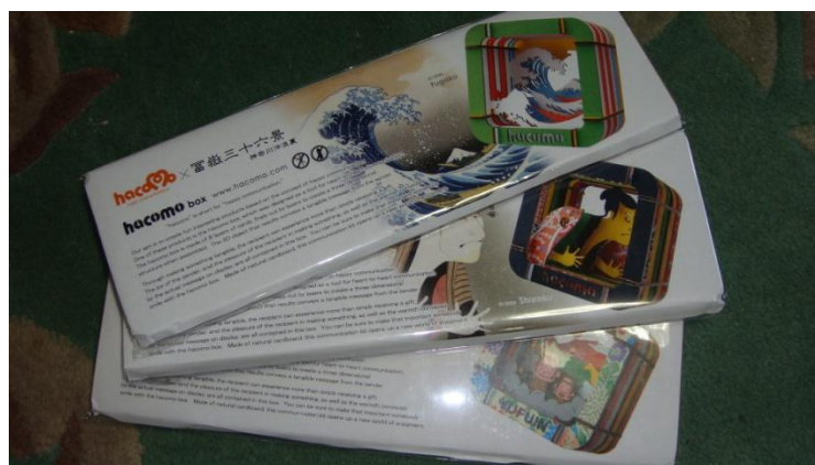
ハコモ(株) hakomobox 様 [富士山/富嶽三十六景等]