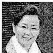
キム・ミョウソン 就職